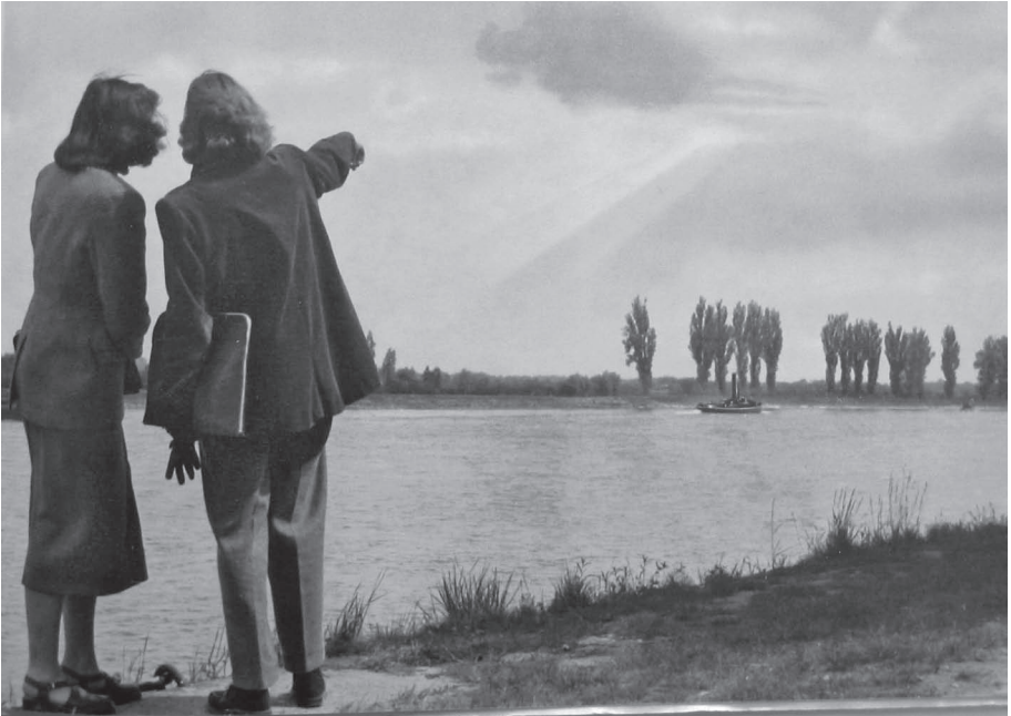
Abb. 6: „Blick in die Ferne ... Tour d’horizon ... Gazing afar ...“ (in: Johannes Gutenberg-Universität Mainz, Auslands- und Dolmetscherinstitut in Gernersheim . Mainz: Druckhaus Schmidt & Co. 1950, o.S. [S. 49])

nung des Rektors von 1947: „Die Staatliche Dolmetscherhochschule Gernersheim hat nicht nur die Aufgabe, den Studierenden bestimmte Kenntnisse zu vermitteln, sondern sie ist eine Erziehungsgemeinschaft.“ 28 Die alte Zitadelle des Nationalismus sollte umgeformt werden zu einer Hochburg der Weltoffenheit und der Internationalität.