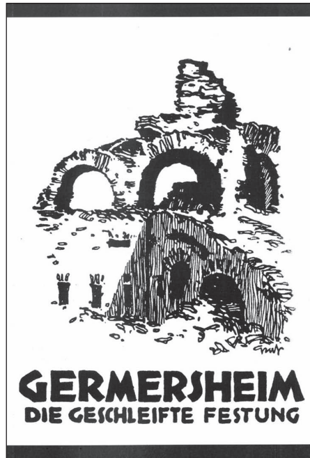
Abb. 2: Titelbild. Georg Ball, Hauptmann a.D., Germersheim, die geschleifte Festung. Geschichte und Führer mit 1 Plan und 13 Abb. Speyer: E. Jäger 1930

geschichtsschreibung immer wieder zurückgegriffen wird. 11 Es scheint von ähnlicher Wichtigkeit wie das große Germersheim-Geschichtswerk von Joseph Probst aus dem Jahre 1898, das bis heute als nicht überholtes Standardwerk gilt. 12