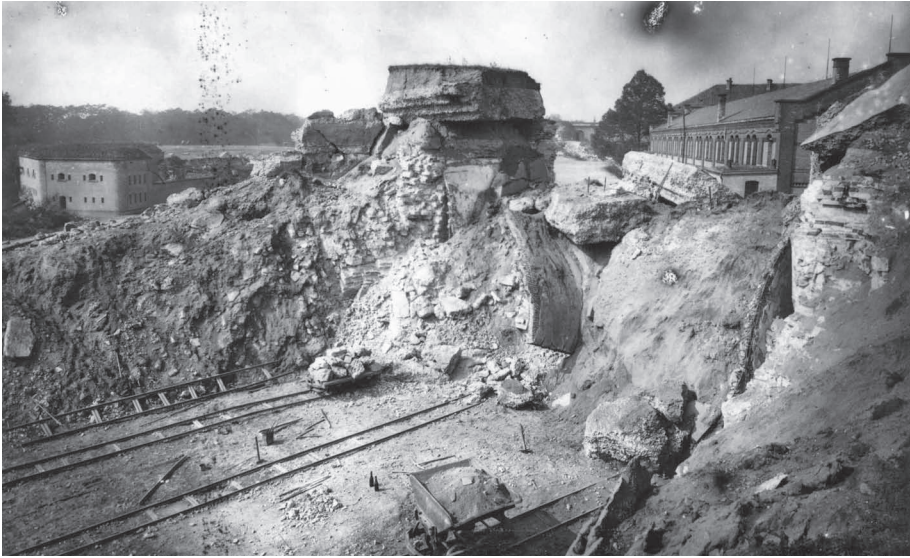
Abb. 3: Schleifung und Einebnungsarbeiten der Festung Germersheim nach 1918 (Archiv der Stadt Germersheim)

es offiziell geplante Gedenkakte (die eher im 19. Jahrhundert, bisweilen aber auch im 20. Jahrhundert ihren Platz haben), seien es ungesteuerte Erinnerungsprozesse, die aufgrund der geschichtlichen Ereignisse und der damit zusammenhängenden Brüchigkeit deutscher Nationalgeschichte eher im 20. Jahrhundert auftreten.