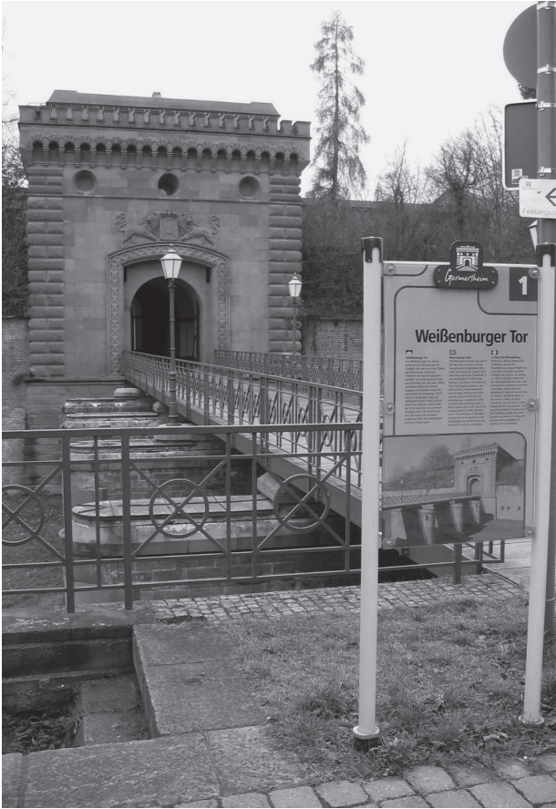
Abb. 1: Festung Germersheim, Weissenburger Tor (2006)

der einstigen Festung, so heißt es immer wieder in den einschlägigen Dokumentationen, bilden erstens ein hervorragendes Beispiel für die hohe Kunst des Festungsbaus im 19. Jahrhundert. In diesem Sinne zitierte z. B. Georg Ball im Jahre 1930 die weit verbreitete Meinung, die Festung Germersheim sei eine „Perle der Festungsbaukunst“. 8 Die Reste der Festung verweisen zweitens auf die historische Bedeutung von Germersheim als Garnisonsstadt im Grenzland. Denn die Festung war Ausdruck eines großen nationalen Projekts zur Abgrenzung und Grenzsicherung gegen den Nachbarn und Gegner